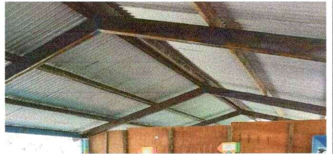
Foto 4: Estructura de techo actual para remozar, Aula 3 y 4 con un Total de 120 mts2 (costaneras oxidadas y lámina de aluminio)