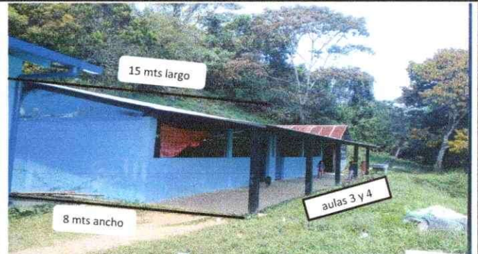
Foto 2: Vista frontal para cubierta de lámina y Estructura de techo con un total de 120 mts2