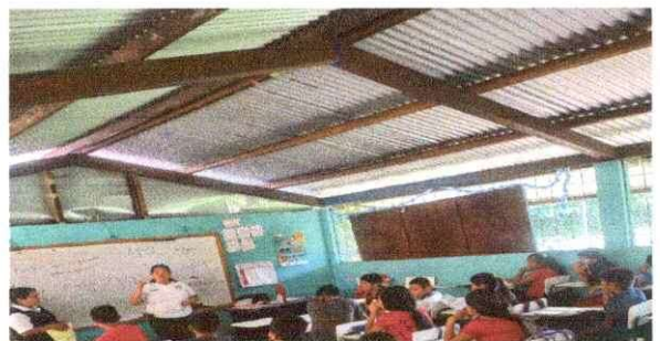
Foto 6: Parte interior de aulas para reforzar columnas y repello blanco de monocapa.

Observación: Si es necesario se pueden agregar hojas adicionales y actualizar el número de hojas.