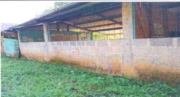
Foto 5: Parte trasera de las aulas 3 y 4 para reforzar columnas y repello blanco de monocapa.