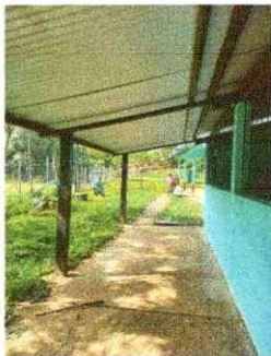
Foto 3: Pasillo que incluye cubierta de techo, Aula 3 y 4 con un Total de 120 mts2